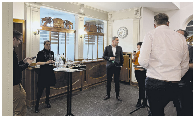
Apéro in der historischen Schalterhalle.

Das Thema Digitalisierung im Investmentbereich ist auch bei klassischen Privatbanken omnipräsent. Die Bank Vontobel hat mit der hauseigenen Applikation volt eine digitale App geschaffen, wofür im Jahr 2019 der Von-