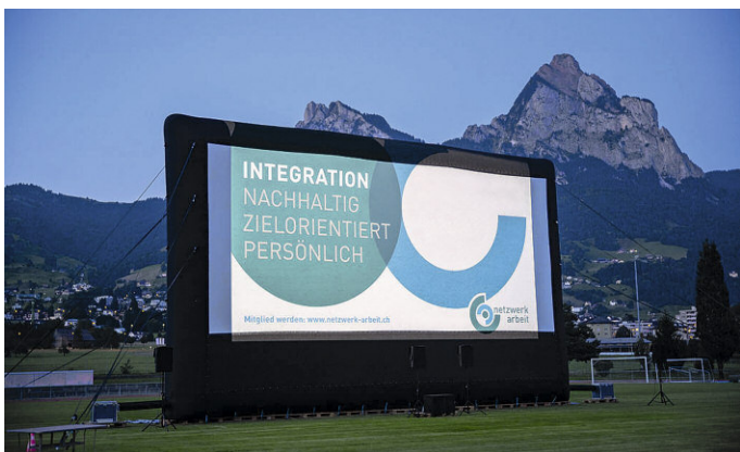
Sommeranlass mit Preisverleihung und Openair-Kino 2021.

The Netzwerk Arbeit association was founded in 2012 as a result of a community project instigated by the Inner Schwyz JCI. Satisfyingly, it still promotes the integration of people with health impairments into the world of employment.