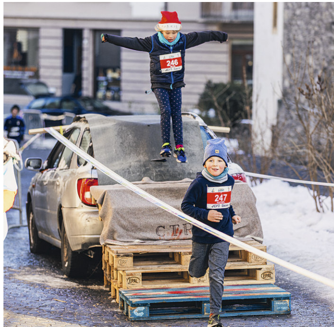
Des participants qui franchissent un des nombreux obstacles.

Cette course se veut ludique et conviviale et a pour objectif de réunir la population de la région autour de la magie de Noël en s'amusant et en pratiquant du sport. Réfléchié autant pour les enfants que les adultes, chaque participant doit effectuer un parcours d'un kilomètre, semé d'obstacles, afin de rallier l'arrivée qui se trouve sur la place de l'hôtel de ville. Chronométrés, les « lutins » ont droit à trois chances pour réaliser le meilleur temps. L'organisation de cet événement a été un véritable challenge pour la commission. Il a fallu coordonner tous les diastères pour assurer le bon déroulement de cette course chronométrée de 10 obstacles, d'un budget à hauteur d'environ CHF 15'000 et nécessitant plus de 50