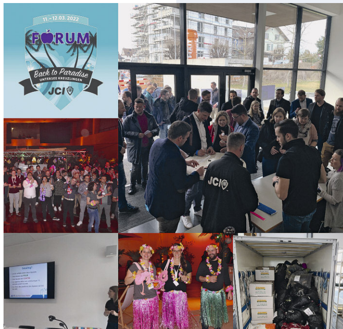
Verschiedene Eindrücke des Forums.

Auch aktuelle Themen wie die Krise in der Ukraine beeinflussten den Anlass. Gerade wegen der internationalen Vernetzung trifft der Krieg viele JCI-Mitglieder ins Herz. Im Rahmen des Forums wurde zusammen mit der LOM Schaffhausen eine Spendensammlung organisiert, die mittels Sammel-LKW Hilfsgüter