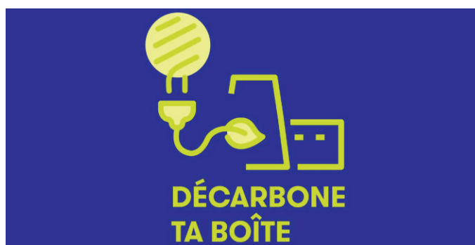
Le Logo du concours.

Les participants ont jusqu'au 15 mai 2022 pour proposer leurs projets, qui seront évalués par un jury composé de professionnels et d'experts du domaine. Les candidats ayant mis en œuvre les projets les plus efficaces, aboutis et innovants auront l'opportunité de participer à la finale publique et médiatisée, qui se tiendra le 8 septembre 2022, et de remporter l'un des