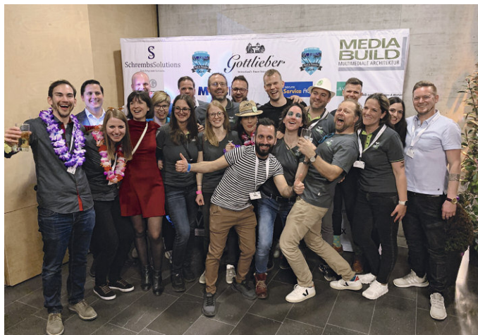
Team CONAKO2022 am Forum.

Dies ist auch das Motto des CONAKO2022 – ohne Senf.