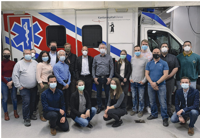
LOM Glarus im Kantonsspital Glarus.

Ein durchwegs positiver Event, welcher auf weitere spannende JCI-Momente im 2022 hoffen lässt. Ganz im Zeichen des diesjährigen Mottos «Xundheit!».