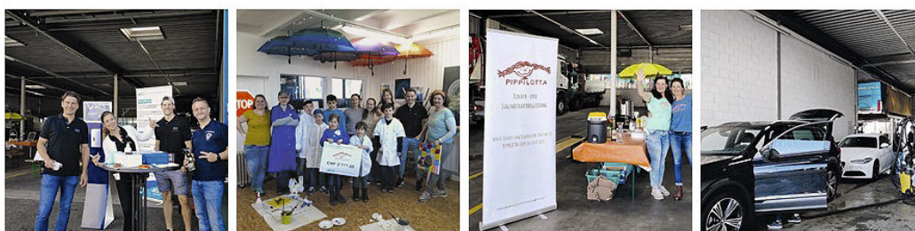
Impressionen vom Carwash sowie von der Scheckübergabe im Werkatelier von Pippilotta.

The Märetfest 2021 was unfortunately cancelled due to COVID. However, that didn't stop the Solothurn LOM from finding another way to roll up their sleeves to aid a good cause.