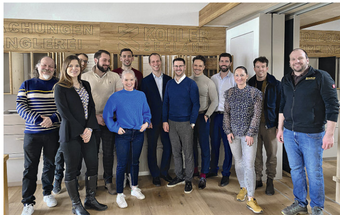
Gute Stimmung am ersten Unternehmerlunch 2022!