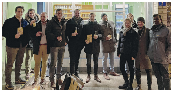
JCIs vor dem QKiosk.