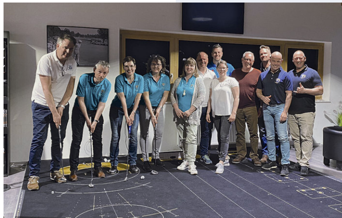
Le 21 mars 2022 une quinzaine de membres de l'ASS se rencontrés pour le Senate Day Romandie

Nach all diesen Entdeckungen und Anstrengungen liessen wir den Abend bei einem Dinner-Apero mit exzellenter Weinbegleitung ausklingen.