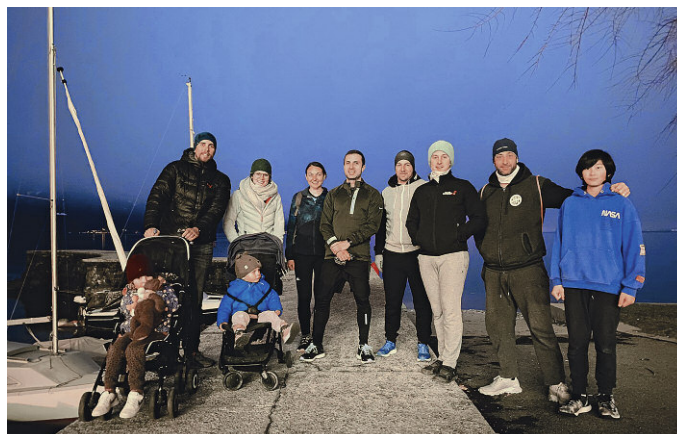
Un groupe de motivé pour une marche nocturne.

En février, la JCI Riviera a rejoint le défi Treely qui consiste à marcher un maximum pendant 10 jours dans le but de planter le plus d'arbres possible. Une équipe de la JCI Riviera s'est donc motivée à marcher, courir et sortir un maximum durant cette période pour accumuler un pas record. On en a profité pour faire des sorties de groupes plus ou moins sportives pour se motiver mutuellement et on a réussi à faire un total de 2154 kilomètres ce qui a généré la plantation de 317 arbres. Une belle réussite !